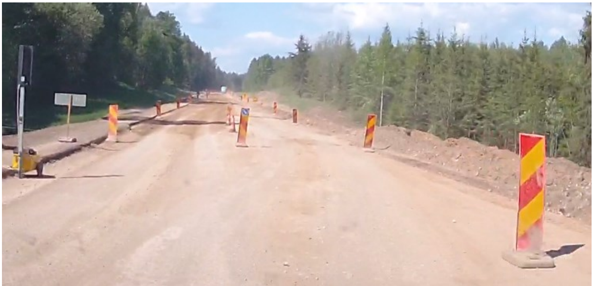
12. Reguleerija märk peab olema vähemalt 150 m enne reguleerijat. Tee keskel puudub vasakule teepolele suunav märk 422