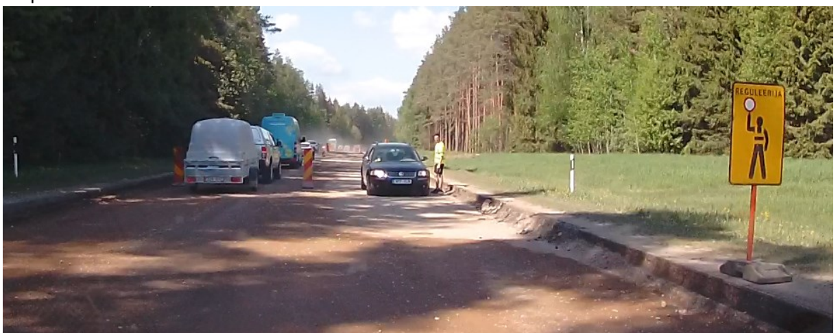
13. Peale reguleerija lõigu lõppu lisada tee teljele 421 kohta, kus tuleb põigata paremale sõidusuunale.