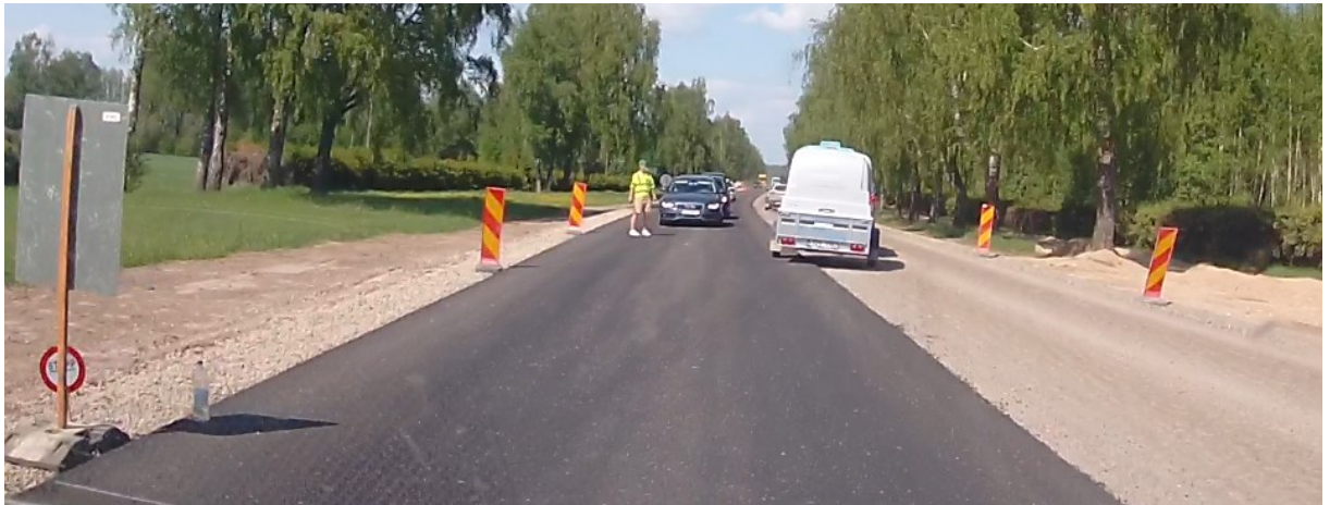
14. Peale Ramsi tee risti puudub märk 351 ning üldskeemil olevad märgid 158+821