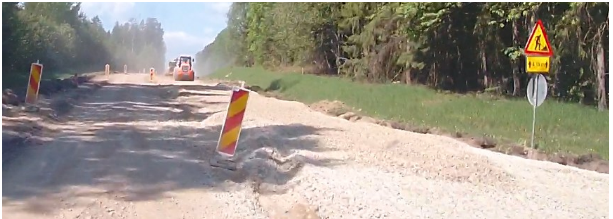
11. Foori lõigu lõpus on raske aru saada, et tuleb reastuda paremale. Panna täiendavalt eraldi märk 421